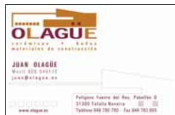
Evolución de las tarjetas de visita de la empresa Olagüe.

as de información realizadas y entre ellas cabe destacar el desarrollo de la web www.olague.es en el 2005. La empresa Quick Multimedia, fue la encargada de acometer este proyecto y se tuvieron en cuenta aspectos ta-